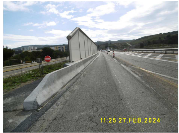
Figure 2 : écrans réalisés

Cette opération a pour objectif de traiter les logements identifiés points noirs du bruit dans trois immeubles de huit étages ainsi qu'une maison individuelle et permet également d'obtenir une diminution de l'ambiance sonore du quartier de Font Sarade.